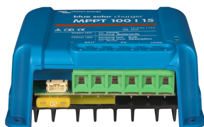
Contrôleur de charge solaire MPPT 100/15